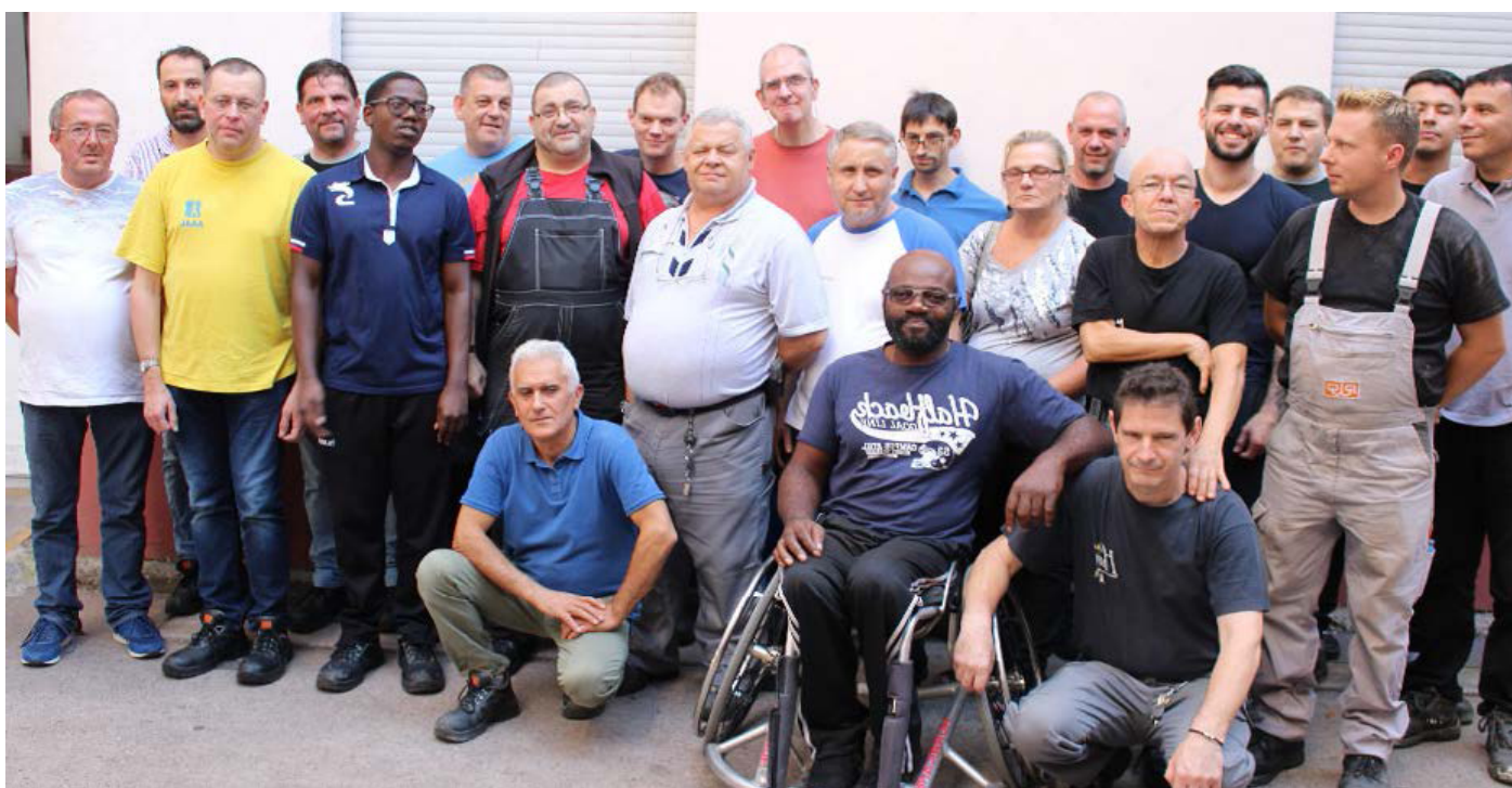
Photo des équipes de production de la Fédération des Aveugles Alsace Lorraine Grand Est